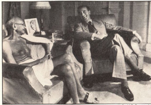
GANDHI & MOUNTBATTEN IN DELHI, bullocks' horns and horses' legs.